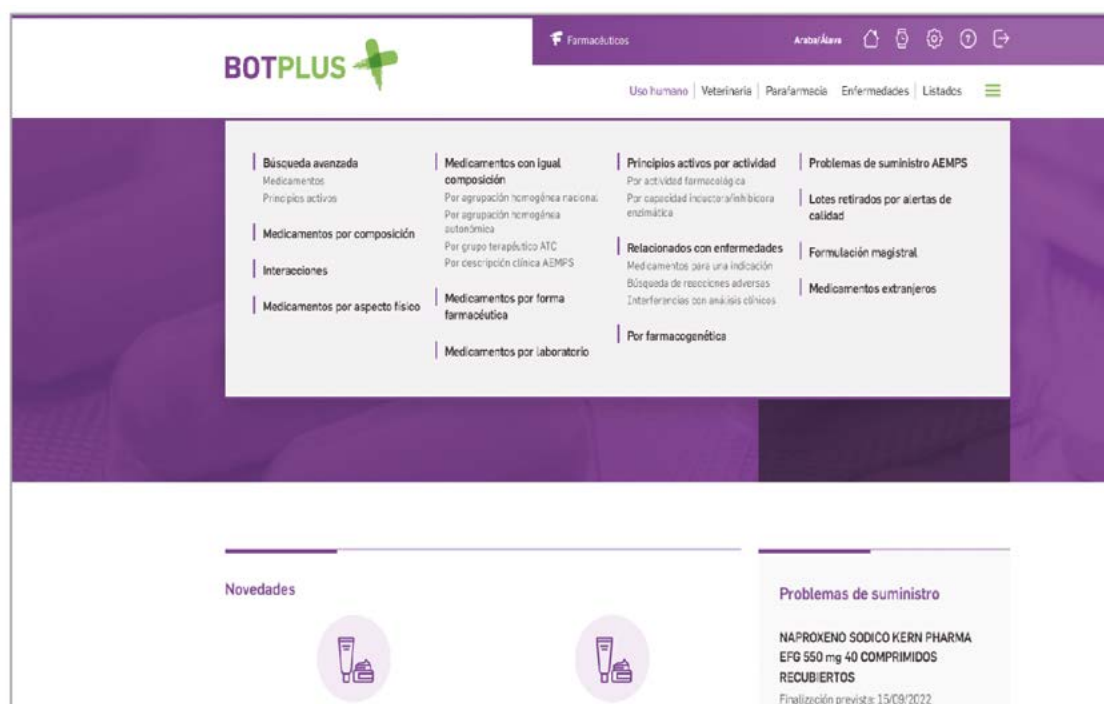
Figura 1. Menú con buscadores en BOT PLUS.

permiten encontrar productos que cumplan con los criterios establecidos por cada usuario, y que ya se incluían en la anterior versión. No obstante, estos buscadores son ahora más accesibles , al haberse incluido en todas las pantallas en forma de menú desplegable ( Figura 1 ).