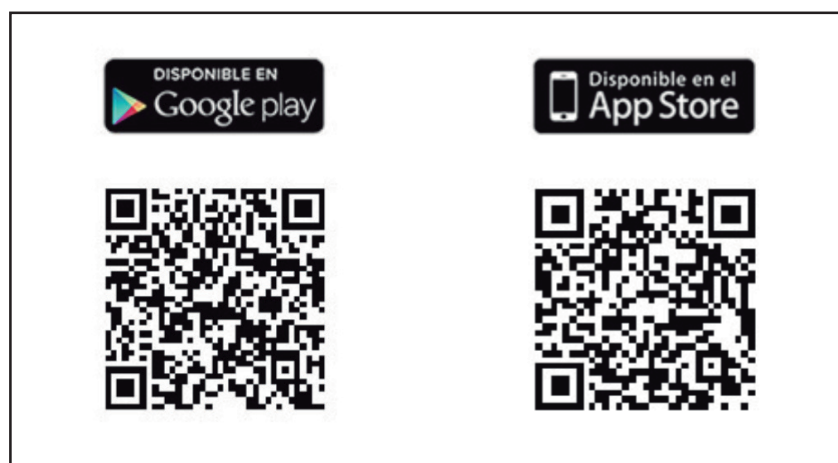
Figura 6. Códigos QR para acceder y descargar la aplicación Bot PLUS App.

Igualmente, se han implementado algunas mejoras principalmente en- caminadas a potenciar un acceso