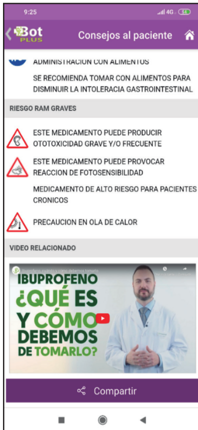
Figura 3. Incorporación de los videoconsejos de Portalfarma en Youtube.

lita la funcionalidad de “Consejos al paciente” con una información enfocada a paciente, con un resumen de la ficha del medicamento, pictogramas, etc. Además, se habilita la posibilidad de compartir esta información directamente con el paciente (mediante las opciones normalmente habilitadas en este tipo dispositivos móviles para compartir cualquier información), de forma que el paciente pueda visualizar esa ficha de consejos al paciente en su dispositivo móvil. Esta información se complementa, además, con la posibilidad de poder compartir el prospecto oficial del medicamento.