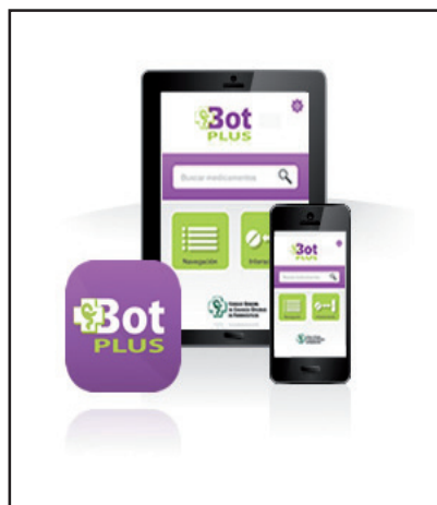
Figura 1. Bot PLUS App disponible para móviles y tabletas.

* Dirección de Servicios Técnicos. Consejo General de Colegios Oficiales de Farmacéuticos.