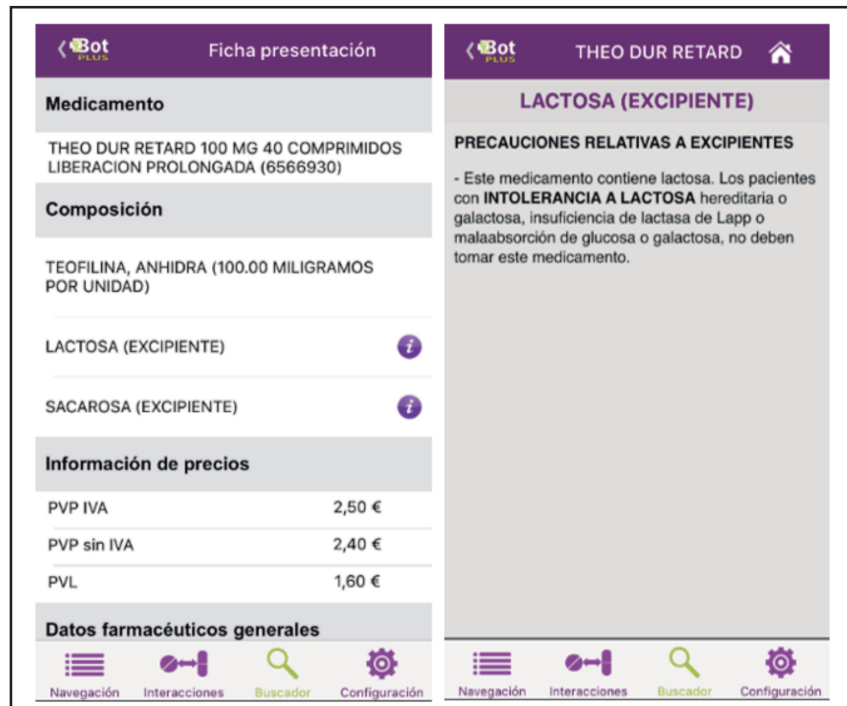
Figura 4. Advertencia del epígrafe “Precauciones relativas a excipientes”.

Por ejemplo, mediante la información detallada sobre los posibles problemas originados por los exciipientes que contienen los medicamentos. Para ello, en la ficha de una determinada presentación del