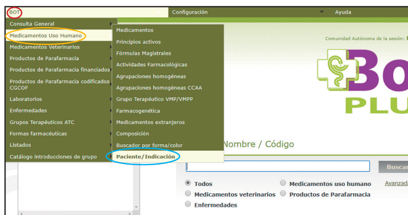
Figura 1. Vía de acceso al buscador Paciente/Indicación, embebido en la pestaña BOT.