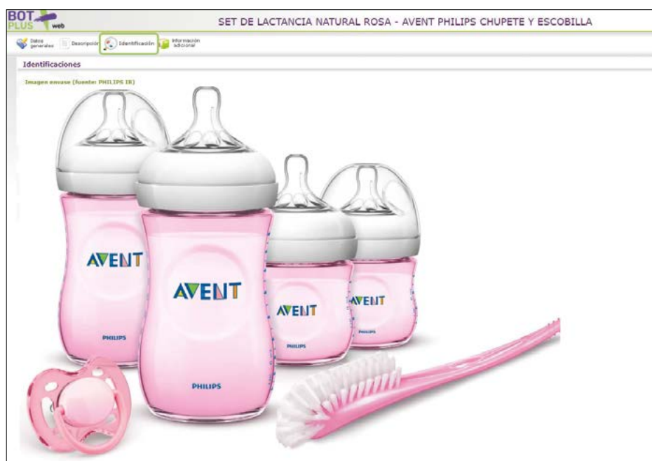
Figura 3. Pestaña de Identificación de un producto de parafarmacia.