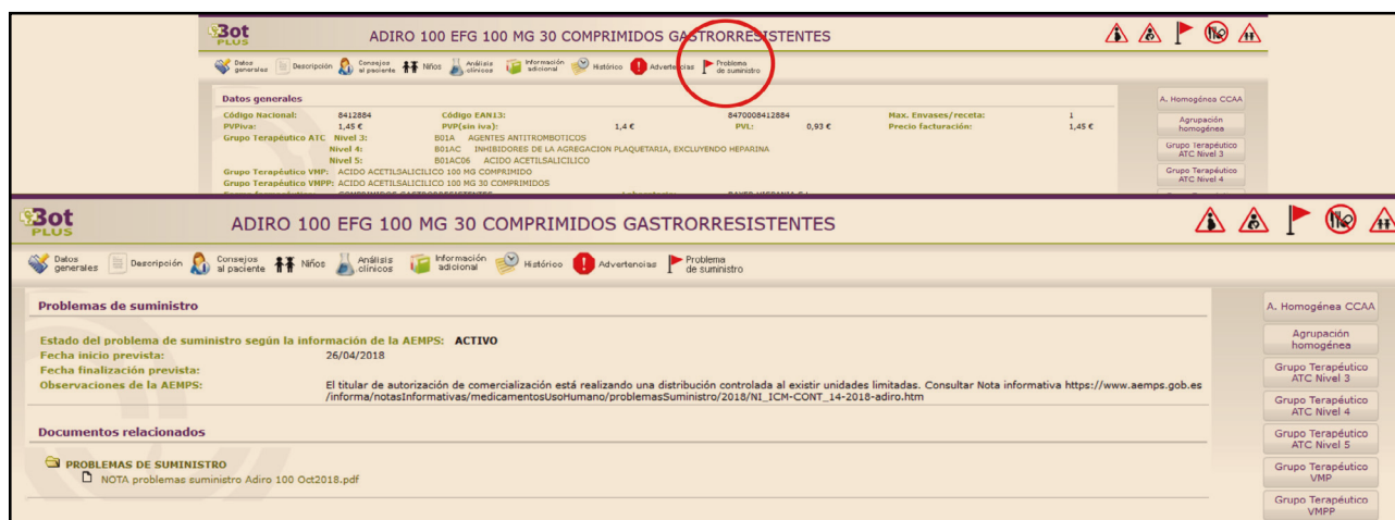
Figura 2. Información ampliada sobre problemas de suministro.